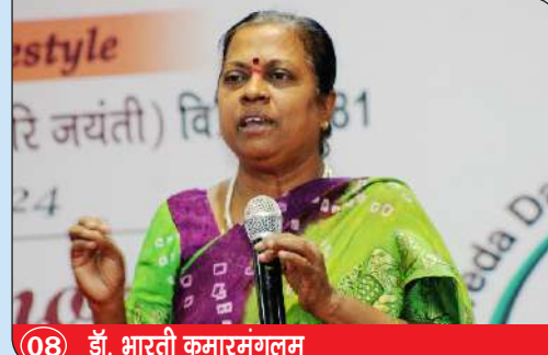
08 डॉ. भारती कुमारमंगलम