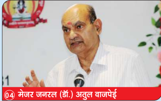
04 मेजर जनरल (डॉ.) अतुल वाजपेई