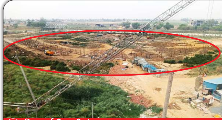
01 निर्माणाधीन क्रीडांगन