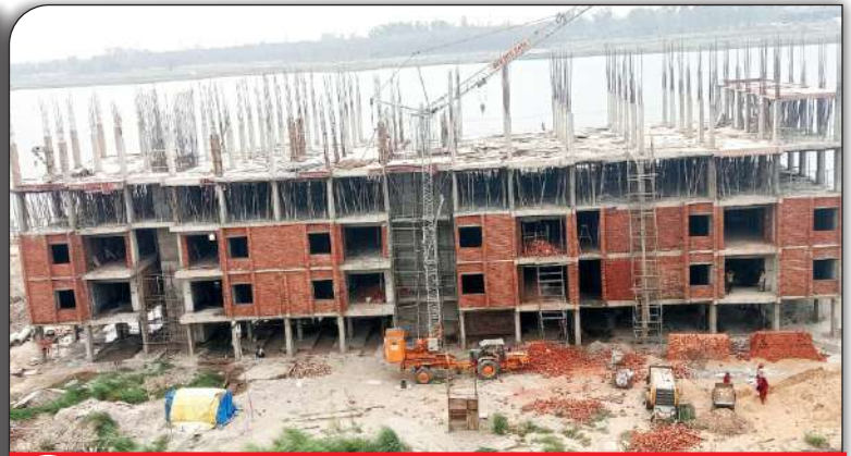
04 निर्माणाधीन शिक्षक आवास