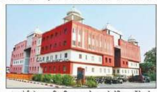
महायोगी गोरखनाथ विश्वविद्यालय आरोग्यधाम के मेडिकल कॉलेज में एमबीबीएस पाठ्यक्रम के लिए 100 सीटों की निजी मान्यता।

अमर उजाला ब्यूरो 100 सीटें हैं। 50 बची हुई सीटों पर जल्द गुरु होगी प्रवेश की प्रक्रिया गोरखपुर। महायोगी गोरखनाथ विश्वविद्यालय के मेडिकल कॉलेज (श्री गोरखनाथ मेडिकल कॉलेज हॉस्पिटल एंड रिसर्च सेंटर) में अब एमबीबीएस की 100 सीटों पर प्रवेश होगा। नेशनल मेडिकल कमीशन (एनएमसी) ने 50 सीटों की मान्यता को बढ़ाकर 100 कर दिया है। पहले मिली सभी सीटों पर नोट स्टेट कोटा काउंसिलिंग के जल्द प्रवेश हो चुका है। जल्द ही बची हुई 50 सीटों पर प्रवेश प्रक्रिया नोट काउंसिलिंग से शुरू हो जाएगी। श्री गोरखनाथ मेडिकल कॉलेज हॉस्पिटल एंड रिसर्च सेंटर में अब एमबीबीएस की मान्यता बढ़ाकर 100 सीटों के लिए कर दी है। यह जानकारी देते हुए श्री गोरखनाथ मेडिकल कॉलेज