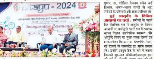
गुरु गोरक्षनाथ इंस्टीट्यूट ऑफ मेडिकल साइंसेज में आयुर्वेद पर तीन दिवसीय राष्ट्रीय संगोष्ठी ‘हितायु’ का शुभारंभ