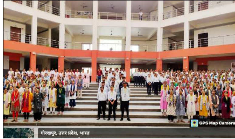
गोरखपुर, उत्तर प्रदेश, भारत