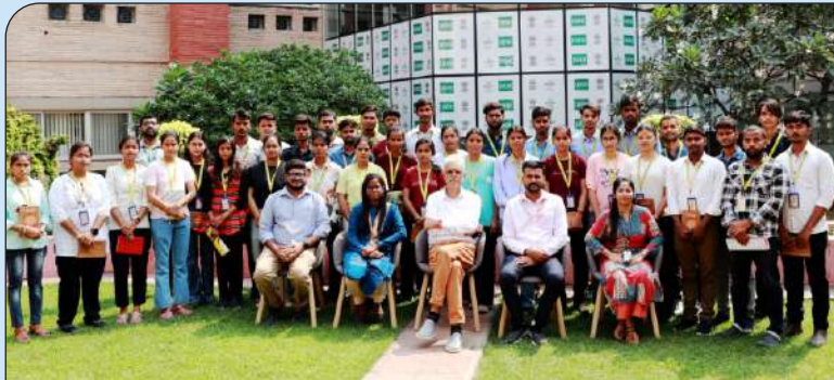
10 काशी हिंदू विश्वविद्यालय में कृषि संकाय के विद्यार्थियों द्वारा शैक्षणिक भ्रमण