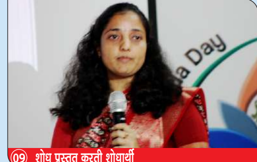
09 शोध प्रस्तुत करती शोधार्थी