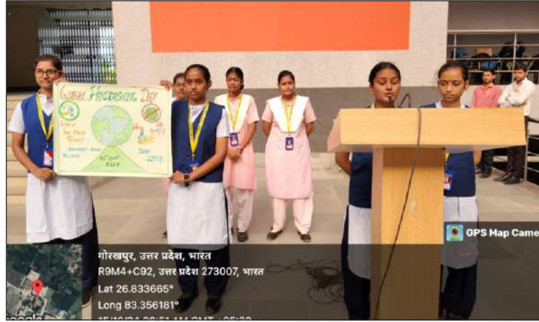
गोरखपुर, उत्तर प्रदेश, भारत R9M4+C92, उत्तर प्रदेश 273007, भारत Lat 26.833665° Long 83.356181°