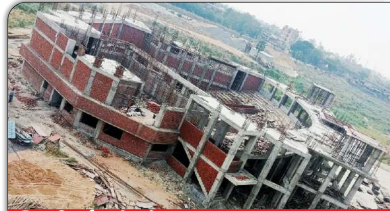
03 निर्माणाधीन प्रेक्षागृह