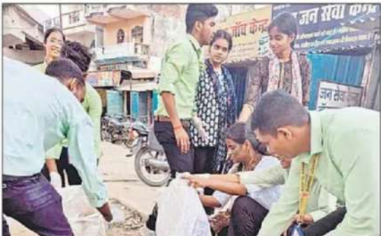
राष्ट्रीय सेवायोजन के स्वयंसेवक जागरूकता कार्यक्रम आयोजित हुआ।