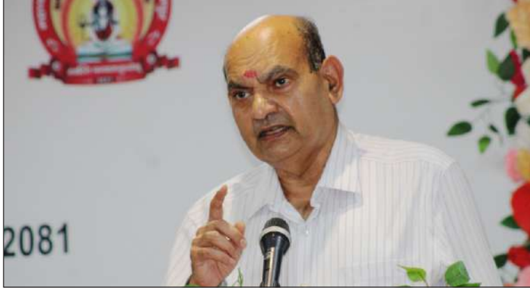
शोधार्थियों को सम्बोधित करते हुए माननीय कुलपति