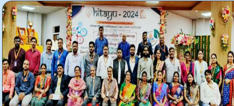
11 आयुर्वेद कॉलेज के प्राचार्य एवं प्राध्यापकगण