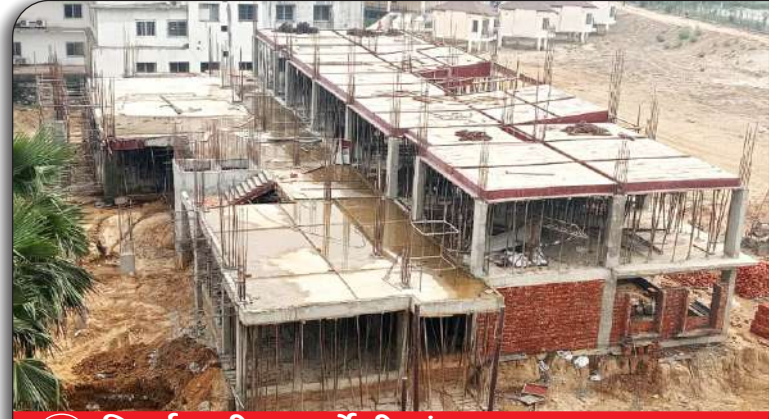
02 निर्माणाधीन फार्मसी संकाय