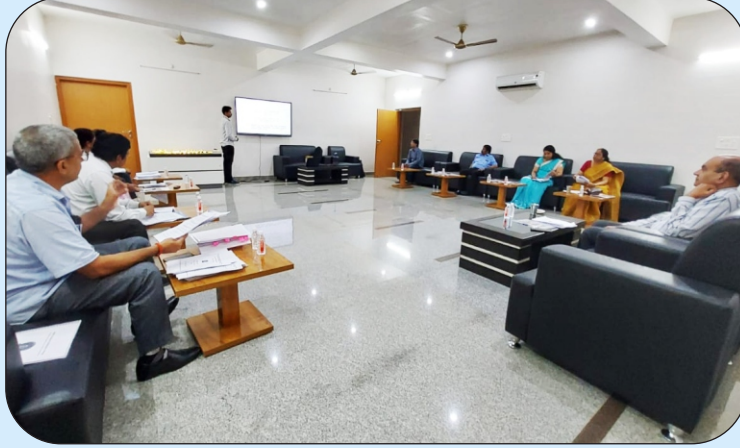
कार्यपरिषद की बैठक में माननीय कुलपति जी व प्राध्यापकगण