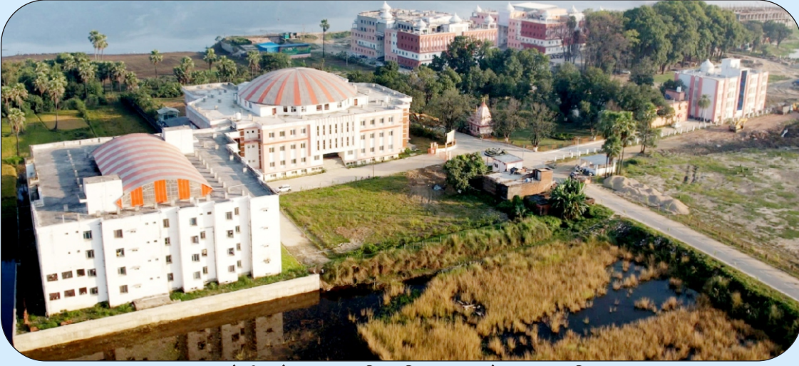
महायोगी गोरखनाथ विश्वविद्यालय गोरखपुर परिसर।

दिनांक: 25 अगस्त, 2023 को स्थापना के महज दो साल में महायोगी गोरखनाथ विश्वविद्यालय ने पूर्वी उत्तर प्रदेश में उच्च, विशिष्ट व रोजगारपरक शिक्षा को नई राह दिखाई है। राष्ट्रीय शिक्षा नीति के आलोक में रोजगारपरक शिक्षा के पाठ्यक्रमों को शुरू कर अल्प समय में ही इस विश्वविद्यालय ने अपनी अलग पहचान कायम की है। मात्र दो साल में बीएएमएस समेत 21 रोजगारपरक पाठ्यक्रमों की शुरुआत, शोध-अनुसंधान के लिए कई प्रतिष्ठित संस्थाओं के साथ एमओयू कर इस विश्वविद्यालय ने गोरखपुर को ज्ञान की नगरी बनाने की दिशा में अपना महत्वपूर्ण योगदान दिया है।