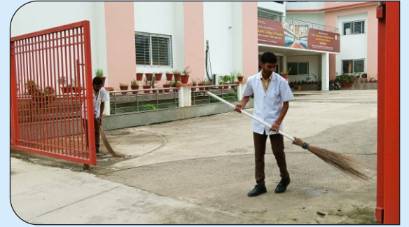
स्वच्छता अभियान में प्रतिभाग करते विद्यार्थी।

दिनांक: 14 अगस्त, 2023 को महायोगी गोरखनाथ विश्वविद्यालय गोरखपुर के पैरामेडिकल संकाय में आजादी के अमृत महोत्सव