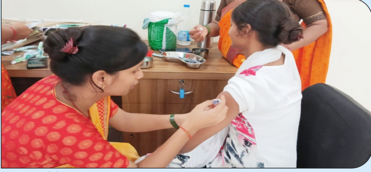
हेपेटाइटिस-बी का टीकाकरण करती शिक्षिका।