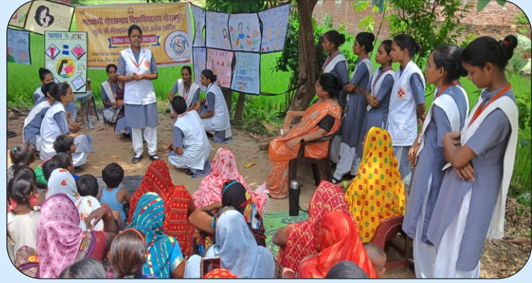
बालापार में ग्रामीणों को स्तनपान संबंधी जानकारी देती छात्राएं

कार्यक्रम में अचल अचंबेनाथ इकाई के विद्यार्थियों के द्वारा रोल प्ले और मास हेल्थ एजुकेशन से स्तनपान के विषय में अवगत कराया।