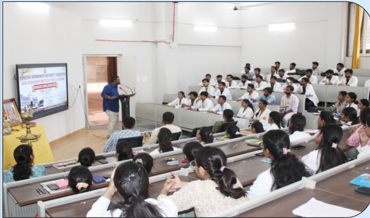
महर्षि चरक जयंती सप्ताह समारोह के दौरान व्याख्यान

दिनांक: 17 अगस्त, 2023 को महायो गी गोरखानाथ विश्वविद्यालय के अंतर्गत संचालित गुरु गोरक्षानाथ इंस्टीट्यूट ऑफ मेडिकल साइंसेस आयुर्वेद कॉलेज में महर्षि चरक जयंती सप्ताह के अंतर्गत क्रिया शारीर विभाग एवं रचना शारीर विभाग द्वारा व्याख्यान आयोजित किया गया जिसमें राजकीय आयुर्वेद