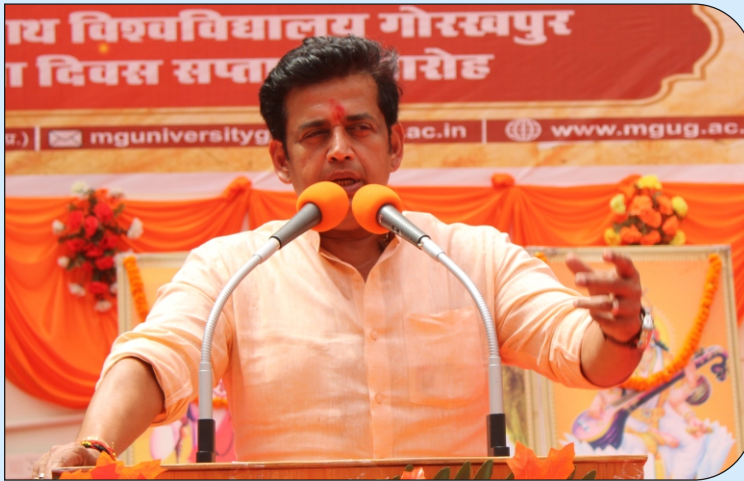
विश्वविद्यालय द्वारा आयोजित 'ओणम' कार्यक्रम में उद्बोधन देते मुख्य अतिथि सांसद रवि किशन एवं सांस्कृतिक प्रस्तुति देती छात्राएं।

दिनांक: 29 अगस्त, 2023 को महायोगी गोरखनाथ विश्वविद्यालय के अंतर्गत संचालित गुरु गोरक्षनाथ कॉलेज ऑफ नर्सिंग ओणम कार्यक्रम आयोजित किया गया। जिसके मुख्य अतिथि गोरखपुर