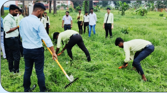
स्वच्छता अभियान में प्रतिभाग करते विद्यार्थी।

दिनांक: 14 अगस्त, 2023 को महायोगी गोरखनाथ विश्वविद्यालय में आजादी के अमृत महोत्सव के श्रृंखला में राष्ट्रीय सेवा