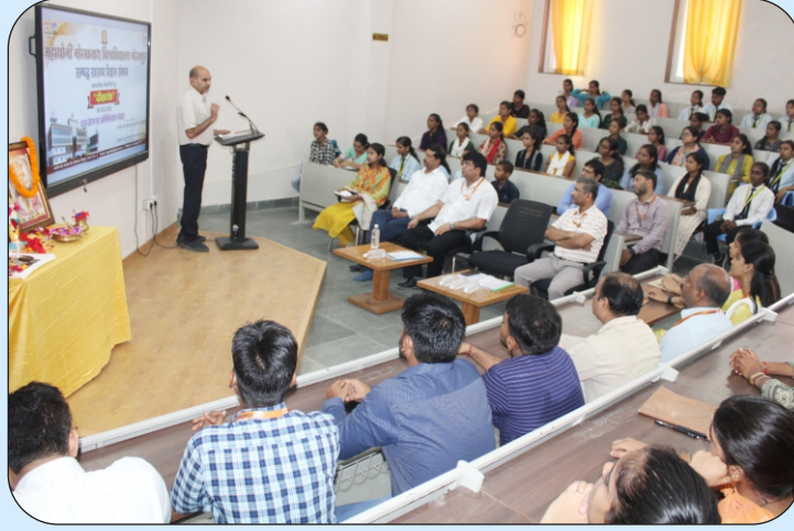
विद्यार्थियों को सम्बोधित करते माननीय कुलपति महोदय।

उद्घाटन सत्र के प्रथम संबोधन में विश्वविद्यालय के माननीय कुलपति जी ने विद्यार्थियों को संबोधित करते हुए कहा कि विश्वविद्यालय एक प्रयोगशाला है, सभी विधा एक दूसरे के पूरक हैं, सभी की अपनी क्षमता है, आरोग्यधाम में मानव सेवा और कल्याण भाव के लिए सदैव तत्पर रहें। जीवन में सदैव नए चुनौतियों आएगी। भविष्य में राष्ट्र और समाज के