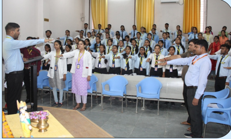
पंचप्रण की शपथ लेते हुए शिक्षकगण व विद्यार्थी