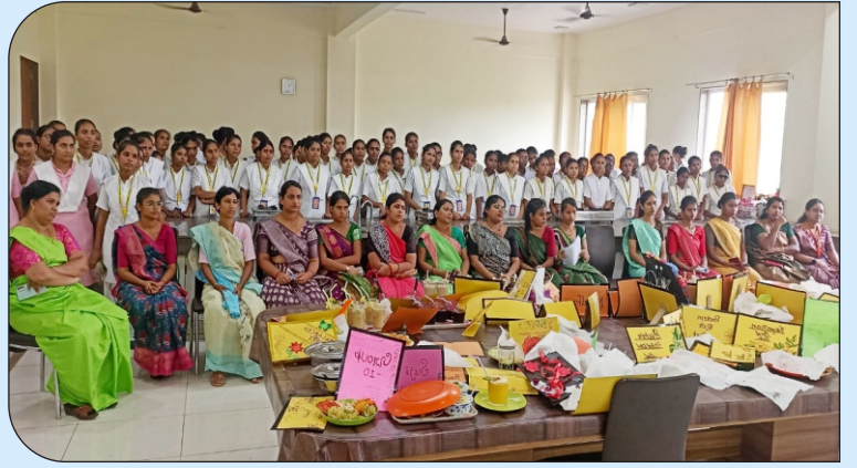
छात्राओं द्वारा बनाए गए व्यंजनों का निरीक्षण करती शिक्षिकाएं।