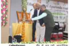
(सुखायु) गुरु गोरखनाथ विश्वविद्यालय गोरखपुर में आयोजित सुखायु आयुर्वेदिक कार्यक्रम का उद्घाटन किया गया।