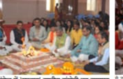
आयुर्वेद के क्षेत्र में कार्यरत लोगों को लकीर का फकीर बनने बचने से बचना होगा। आज के दौर में बच रही आयुर्वेदिक औषधियों की वैज्ञानिक गुणवत्ता सिद्ध करने का प्रयास करना होगा।