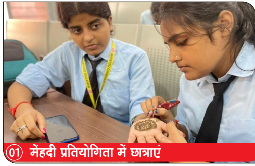
01) मेहदी प्रतियोगिता में छात्राएं