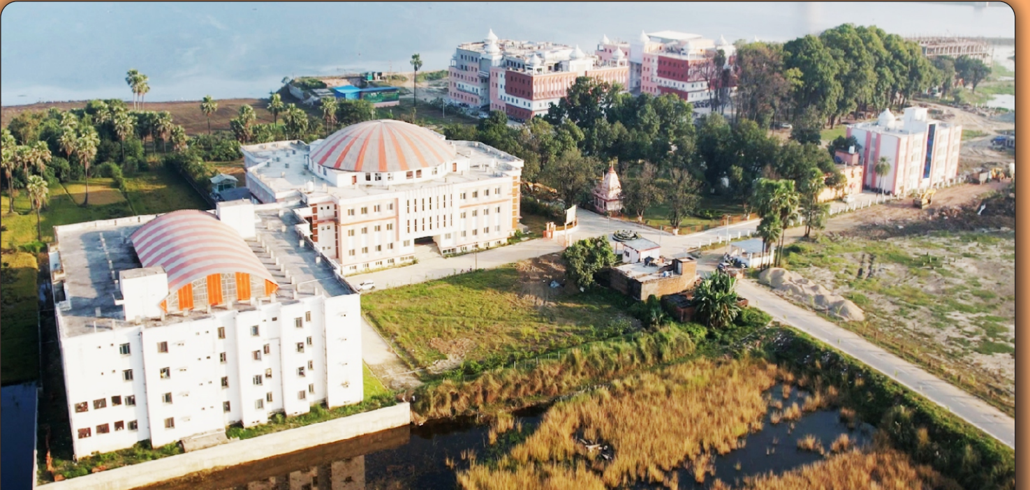
05 विश्वविद्यालय परिसर का वायवीय दृश्य