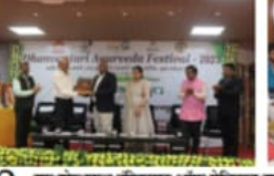
गुरु गोरक्षनाथ इंस्टिट्यूट ऑफ मेडिकल साइंसेज में सुखायु राष्ट्रीय संगोष्ठी का समापन