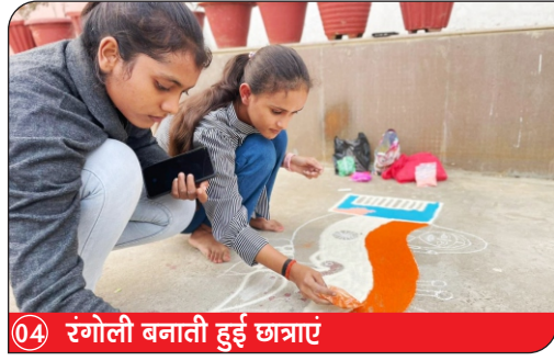
04) रंगोली बनाती हुई छात्राएं