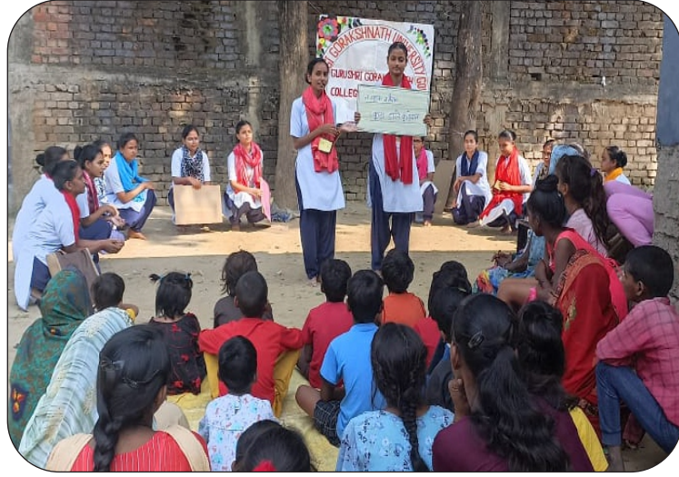
खत्रीपुरा में ग्रामीणों को जागरूक करती छात्राएं

दिनांक: 02 नवम्बर, 2023 को महायोगी गोरखनाथ विश्वविद्यालय गोरखपुर के अंतर्गत संचालित गुरु श्री गोरखनाथ कॉलेज ऑफ नर्सिंग में अध्ययनरत तृतीय वर्ष की 15 छात्राओं द्वारा ग्राम खत्रीपुरा में मास हेल्थ एजुकेशन का कार्यक्रम आयोजित किया गया। कार्यक्रम की शुरुआत रोलप्ले से की गई।