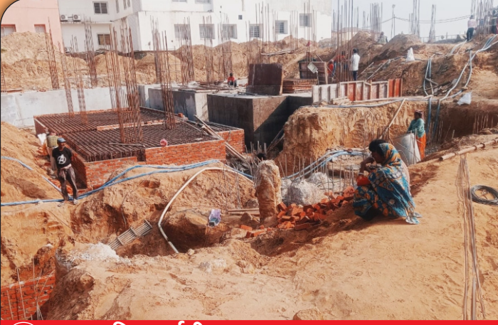
01 निर्माणाधीन प्राध्यापक आवास