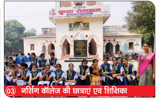
03) नर्सिंग कॉलेज की छात्राएं एवं शिक्षिका