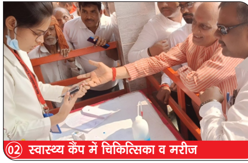
02) स्वास्थ्य कैंप में चिकित्सिका व मरीज