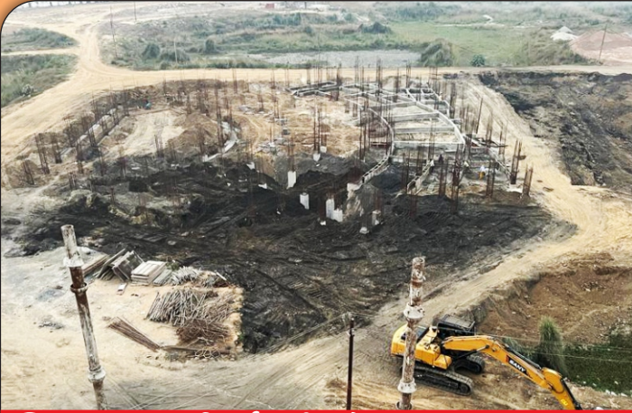
03 निर्माणाधीन प्रेक्षागृह