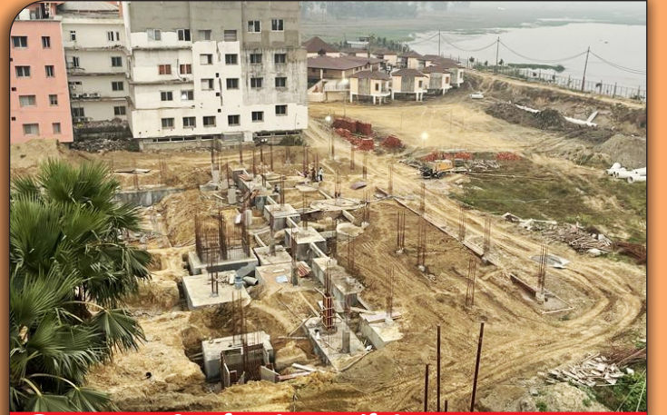
04 निर्माणाधीन फार्मसी संकाय