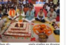
सुखायु आयुर्वेदिक कार्यक्रम का समापन हुआ।