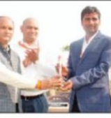
गुरु गोरखनाथ विश्वविद्यालय गोरखपुर द्वारा संचालित संबद्ध स्वास्थ्य विज्ञान संकाय व फार्मसी संकाय के संयुक्त तत्वावधान में ट्रांसलेशन बायोमेडिकल रिसर्च सोसायटी के सहयोग से तीन दिवसीय राष्ट्रीय संगोष्ठी का आयोजन 15 दिसंबर से किया जाएगा। संगोष्ठी में मंथन करने के लिए देश के कई प्रतिष्ठित वैज्ञानिक यहां आएंगे।