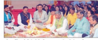
गुरु गोरखनाथ विश्वविद्यालय गोरखपुर के अंतर्गत संचालित गुरु गोरखनाथ इंस्टिट्यूट ऑफ मेडिकल साइंसेज (आयुर्वेद कॉलेज) में तीन दिवसीय 'सुखायु' राष्ट्रीय संगोष्ठी का समापन हुआ।

रही आयुर्वेदिक औषधियों की वैज्ञानिक गुणवत्ता सिद्ध करने का प्रयास करना होगा। आयुर्वेदिक अकार्यों को प्रयोगात्मक शिक्षण पर अधिक प्रयास करना होगा। कुलपति ने घोषणा की कि आगामी महीने में आयुर्वेदिक विद्यालय और महायोगी गोरखनाथ विश्वविद्यालय के संयुक्त तत्वावधान में आयुर्वेद कॉलेज में नई परीक्षा पर आधारित कार्यक्रमा का आयोजन किया जाएगा।