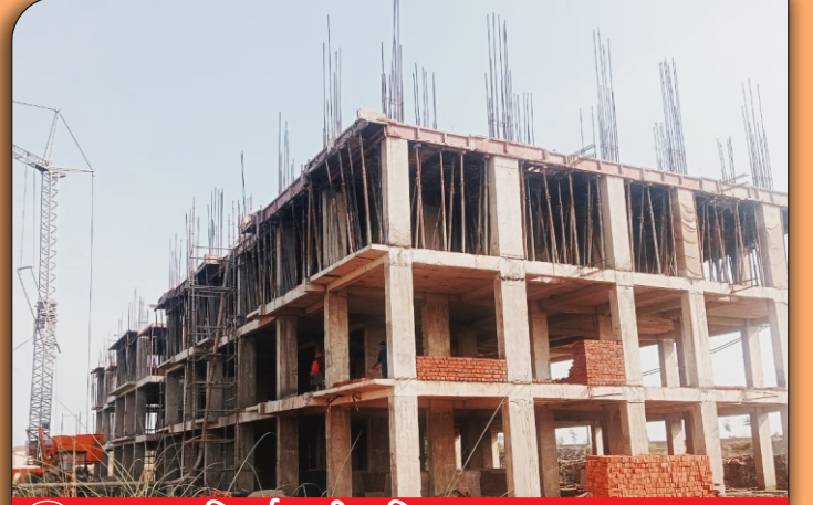
02 निर्माणाधीन शिक्षक आवास