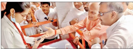
स्वास्थ्य शिविर में चिकित्सकों को जांच कराते लोग।