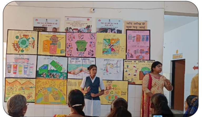
पोस्टर के माध्यम से कचरे निस्तारण पर जागरूक करती छात्राएं

मास हेल्थ एजुकेशन के अंतर्गत चार्ट पेपर, एवं अलग-अलग एवी एड्स के द्वारा हेल्थ एजुकेशन दिया गया जिसमें विभिन्न प्रकार के विषय जैसे वेस्ट डिस्पोजल के विषयों में बताया गया।