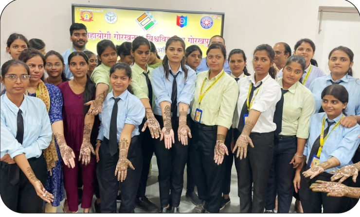
मेंहदी प्रतियोगिता में हाथों पर बनाई गई मेंहदी दिखाती छात्राएं

दिनांक 06 नवम्बर, 2023 महायोगी गोरखनाथ विश्वविद्यालय में निर्वाचन आयोग द्वारा संकल्पित मतदाता जागरूकता अभियान के अंतर्गत मेंहदी प्रतियोगिता में विद्यार्थियों ने मतदान का संकल्प लिया। विश्वविद्यालय में मतदाता जागरूकता अभियान के तहत मेंहदी प्रतियोगिता में सभी संकायों के छात्र-छात्राओं ने 'मेरा वोट, मेरा अधिकार, चलो मतदान करें' विषय को केंद्रित