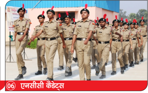
06) एनसीसी कैडेट्स