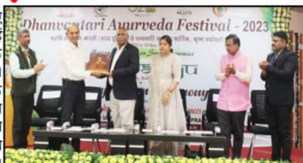
गुरु गोरखनाथ विश्वविद्यालय गोरखपुर के अंतर्गत संचालित गुरु गोरखनाथ इंस्टिट्यूट ऑफ मेडिकल साइंसेज (आयुर्वेद कॉलेज) में तीन दिवसीय सुखायु राष्ट्रीय संगोष्ठी का समापन शुक्रवार को धन्वंतरि जयंती के पावन पर्व पर हुआ।