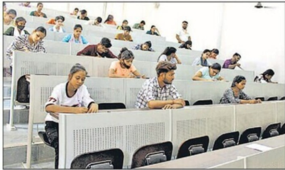
गोरक्षनाथ विश्वविद्यालय में प्रवेश परीक्षा देते छात्र।