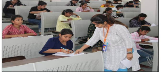
बीएससी नर्सिंग प्रथम वर्ष की प्रवेश परीक्षा में शामिल अभ्यर्थी। संवाद