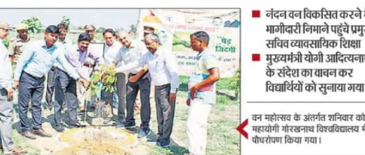
नंदन वन विकसित करने में भागीदारी निभाते पहुंचे प्रमुख सचिव व्यावसायिक शिक्षा

गोरखपुर, वरिष्ठ संवाददाता। वन महोत्सव के अंतर्गत शनिवार को महायोगी गोरक्षनाथ विश्वविद्यालय ने नंदन वन विकसित करने के साथ ही सभी संवाचित संस्थानों के परिसरों को हरियाली से समृद्ध किया।