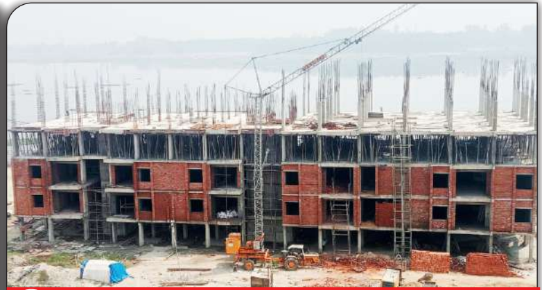
04 निर्माणाधीन शिक्षक आवास