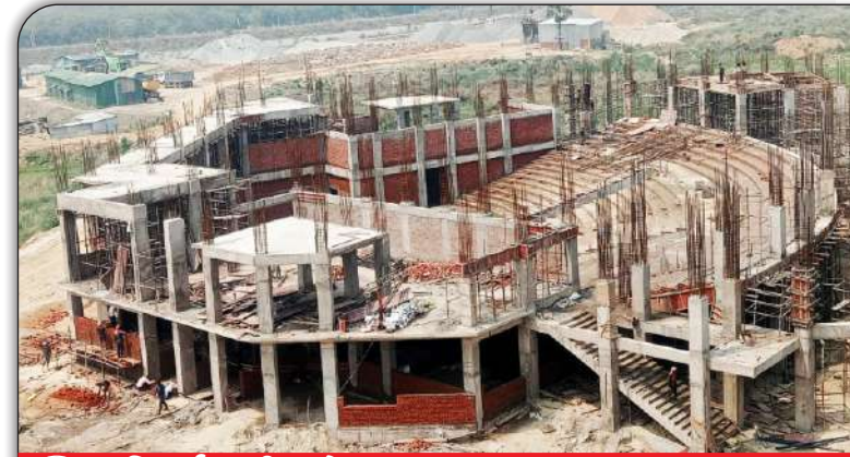
03 निर्माणाधीन प्रेक्षागृह