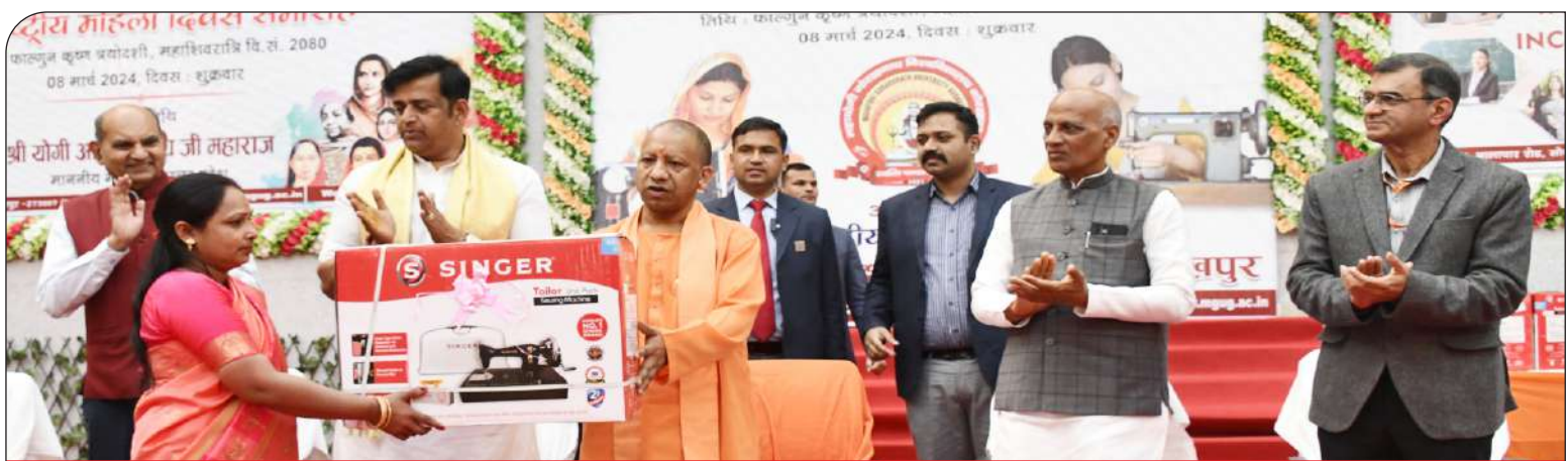
10 ग्रामीण महिलाओं को सिलाई मशीन वितरित करते हुए विश्वविद्यालय के माननीय कुलाधिपति श्री योगी आदित्यनाथ जी महाराज