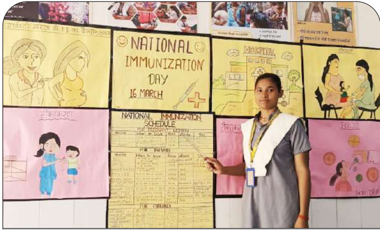
टीकाकरण के बारे में जागरूक करती नर्सिंग की छात्रा