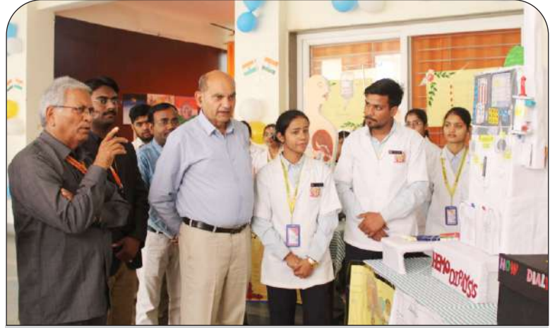
विद्यार्थियों द्वारा बनाए गए प्रदर्शनी का अवलोकन करते हुए गणमान्य

किडनी की बिमारी मुख्य रूप से लम्बे समय तक मधुमेह और अनियंत्रित उच्च रक्तचाप; जिसका लम्बे समय तक इलाज न किया गया हो। साथ ही साथ हर साल एक थीम के साथ दुनिया भर में मनाया जाता है। इस साल का थीम है। 'सभी के लिए किडनी स्वस्थ: देखभाल और इष्टतम दवाएँ अभ्यास तक समान पहुंचाने को बढ़ावा देना।'