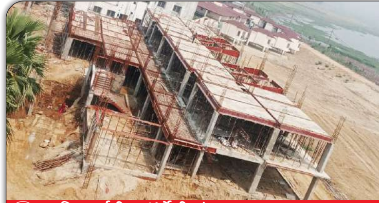
01 निर्माणाधीन फॉर्मेसी संकाय (दृश्य-1)