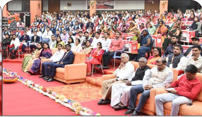
सम्बोधित करते हुए माननीय कुलाधिपति श्री योगी आदित्यनाथ जी महाराज एव उपस्थिति अतिथिगण

है। इसी प्रतिबद्धता से महाराणा प्रताप शिक्षा परिषद एवं महायोगी गोरखनाथ विश्वविद्यालय भी महिलाओं के सम्मान-स्वावलंबन के लिए सराहनीय योगदान दे रहा है।