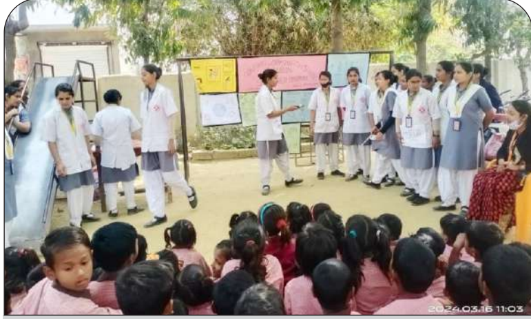
विद्यार्थियों को मास हेल्थ एजुकेशन के प्रति जागरूक करती छात्राएं

दिनांक 16 मार्च, 2024, गोरखनाथ विश्वविद्यालय गोरखपुर। को महायोगी गोरखपुर के अंतर्गत संचालित