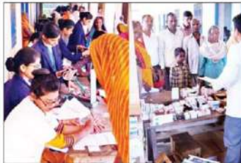
आभार में आभार ज्ञापन में उपस्थित गुरु गोरखनाथ इंस्टिट्यूट ऑफ मेडिकल साइंसेज के अध्यक्ष

गुरु गोरखनाथ इंस्टिट्यूट ऑफ मेडिकल साइंसेज बालापर