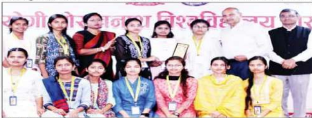
रासेयो शिविर के समापन पर पुरस्कृत छात्राएं व अन्य।