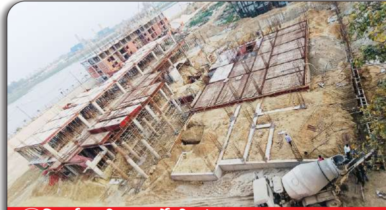
02 निर्माणाधीन फॉर्मेसी संकाय (दृश्य-2)