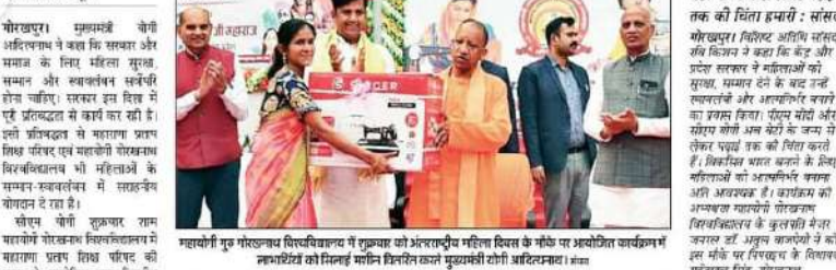
महायोगी गुरु गोरखनाथ विध्यालय में मुख्यमंत्री को अंतरराष्ट्रीय महिला दिवस के मौके पर प्रथमोक्ति कार्यक्रम में सिलाई मशीन प्रदान करने में महिलाओं को सौंपने पर सिलाई मशीन दिनांक।

महायोगी गोरखनाथ विध्यालय में महिलाओं को मुख्यमंत्री ने दिया सिलाई मशीन का उपहार