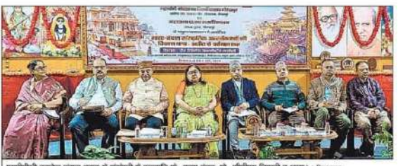
एमपीजी कॉलेज जंगल धूसड़ में राष्ट्रीय व अंतरराष्ट्रीय सेमिनार का समापन कार्यक्रम।

सेमिनार गोरखपुर, निज संवाददाता। भारत और नेपाल के बीच भाव और भावना का संबंध है। ऐसा संघर्ष राजनीति और आर्थिक के संबंधों से नहीं बल्कि मजबूत और गहरा होता है। दोनों राष्ट्रीय के संस्कृत और अर्थशास्त्र एक समान हैं। दोनों धार्मिक व आध्यात्मिक दर्शन के मजबूत डोर से बंधे हुए हैं।