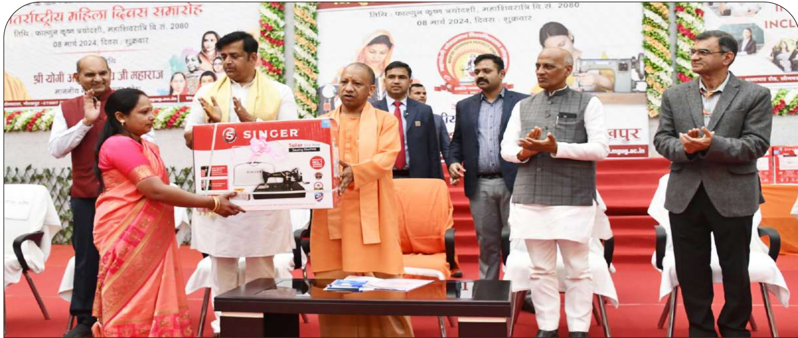
ग्रामीण महिलाओं को सिलाई मशीन वितरित करते हुए विश्वविद्यालय के कुलाधिपति श्री योगी आदित्यनाथ जी महाराज

दिनांक 08 मार्च, 2024, गोरखपुर। मुख्यमंत्री योगी आदित्यनाथ ने कहा कि डबल इंजन सरकार की नीतियों और