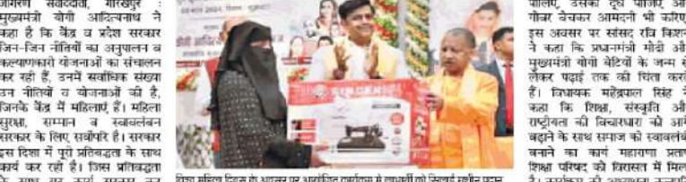
महायोगी गोरखनाथ विधि में निशुल्क सिलाई-कढ़ाई प्रशिक्षण प्राप्त कर रही महिलाओं को मुख्यमंत्री ने दिया सिलाई मशीन का उपहार

निशुल्क सिलाई-कढ़ाई प्रशिक्षण प्राप्त कर रही महिलाओं को मुख्यमंत्री ने दी सिलाई मशीन