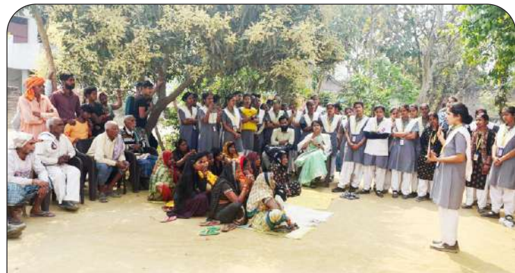
क्षयरोग पर जागरूक करती नर्सिंग कॉलेज की छात्रा