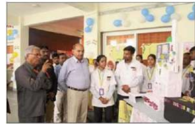
लोकभारती न्यूज ध्युरो

गोरखपुर। महायोगी गोरखनाथ विश्वविद्यालय के महंत अवेद्यनाथ पैरामेडिकल कॉलेज में गुरुवार को विश्व किडनी दिवस मनाया गया। इस अवसर पर विद्यार्थियों ने किडनी व डायलिसिस से संबंधित यूरिनरी सिस्टम, नेफ्रॉन, मिक्रोशेन, पीरिटोनियल डायलिसिस, हेमोडायलिसिस व डायलिसिस मरीजों के लिए नुद्दिशन के