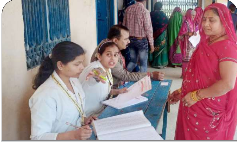
मरीजों का रजिस्ट्रेशन करती हुई नर्सस।

दिनांक 10 मार्च, 2024, गोरखपुर। को गुरु गोरखनाथ इंस्टीट्यूट ऑफ मेडिकल