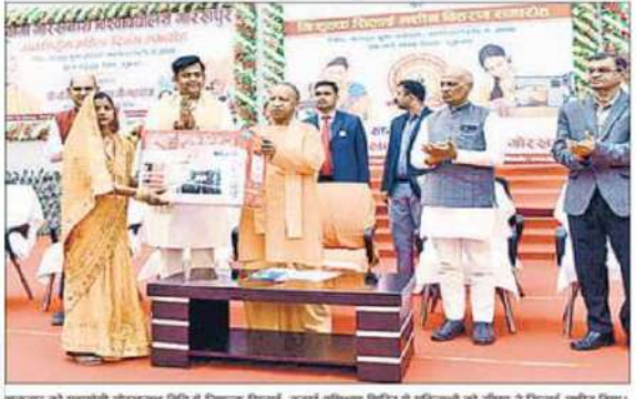
मुद्राकार को महायोगी गोरखनाथ विधि में निशुल्क सिलाई-कढ़ाई प्रशिक्षण प्रदान करने में महिलाओं को सौंपने पर सिलाई मशीन दिनांक।