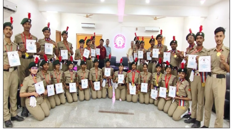
प्रमाण पत्र के साथ एन.सी.सी. कैडेट्स